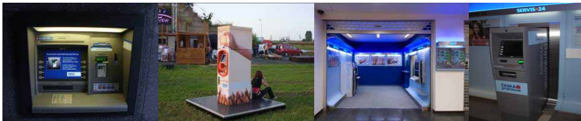
Transakční terminály 3. března 2010